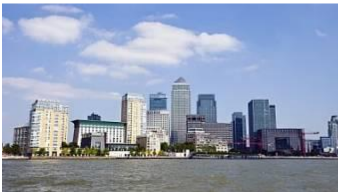
Canary Wharf); HSBC Tower (200 m) a Citigroup Centre (200 m).

Canary Wharf , spadající do městského obvodu Tower Hamlets, je velké finanční centrum v Londýně, ležící na Isle of Dogs (Ostrov psů), v bývalých londýnských docích (Docklands). Canary Wharf je novodobý následník londýnského City. Nacházejí se na něm do nedávna tři nejvyšší budovy Velké Británie: Canada Square (235 m, můžeme se také setkat s názvem Věž